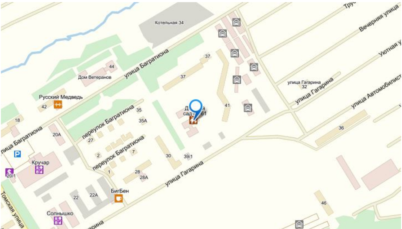
Схема района расположения МБДОУ д/с №61